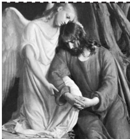
« Un ange le fortifia » (Lc 22,43)

Tout devient grâce pour qui sait voir sous l'angle de la foi en l'amour divin.